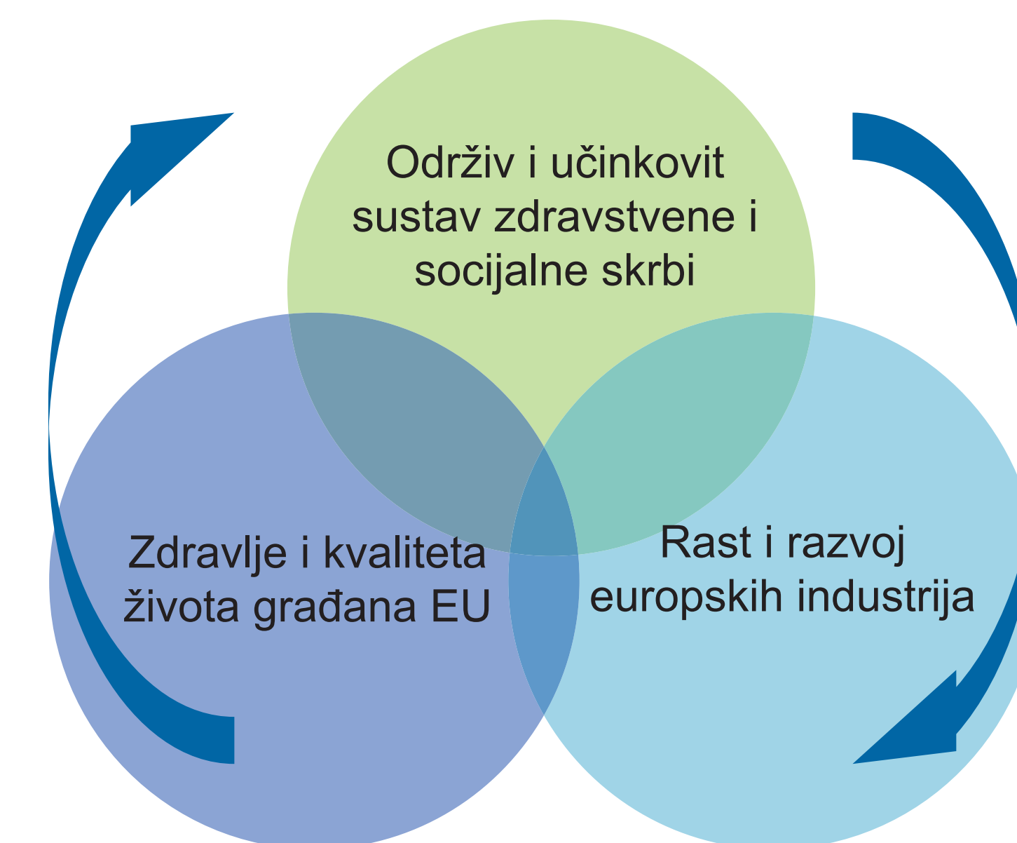
Slika 1. Trostruki dobitak za Europu